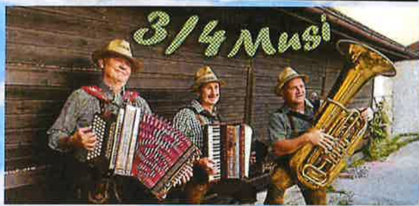
ab 17.00 Uhr 3/4 Musi ( ohne Verstärker)